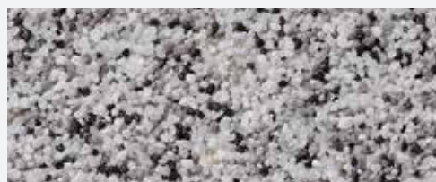
M 329 Cristallo