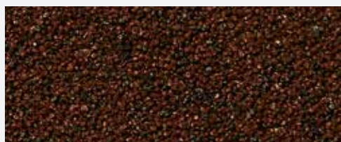
M 317 El Capitan