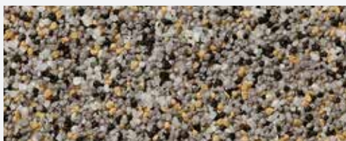
M 326 Triglav