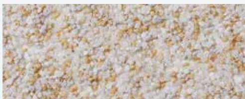
M 301 Albaron