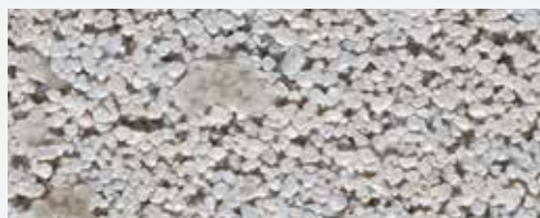
M 337 Montblanc