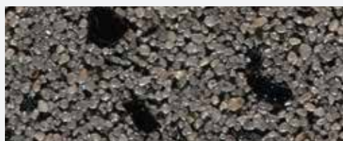
M 342 Everest