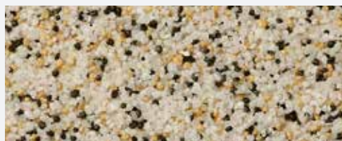
M 325 Bellavista

Цветът на фасадата привлича погледа дори от разстояние. Често това е първото нещо, което се забелязва. Цветните кварцови пясъци в специално подбрани нюанси, характеризиращи мазилката Баумит МозаикТоп, дават възможност за създаване на разнообразни ефекти върху фасадата. Уникалният им вид и цвят ще останат жизнени в продължение на много години.