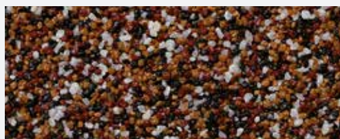
M 316 Kosh