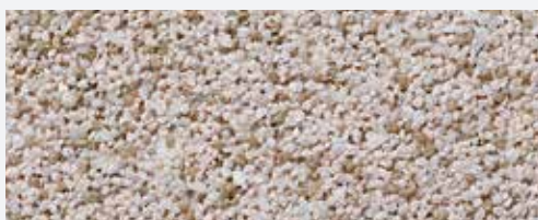
M 303 Matterhorn