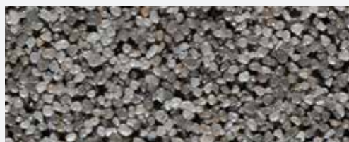
M 341 Rocky