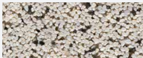
M 338 Olympus