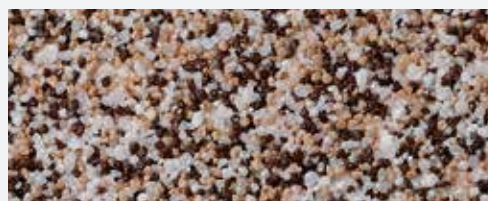
M 304 Denali