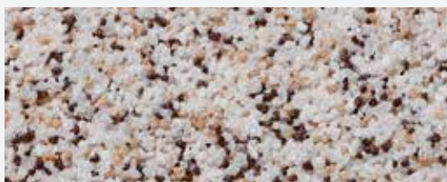
M 307 Bistra