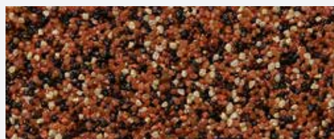
M 315 Rodna