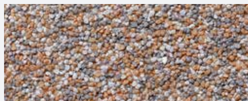
M 302 Monviso