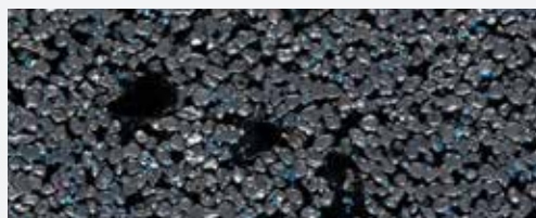
M 343 Etna