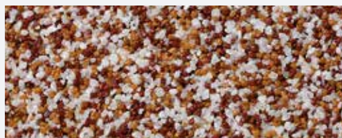
M 312 Cook