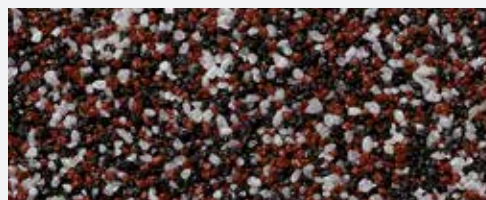
M 313 Athos