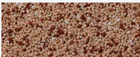
M 305 Victoria