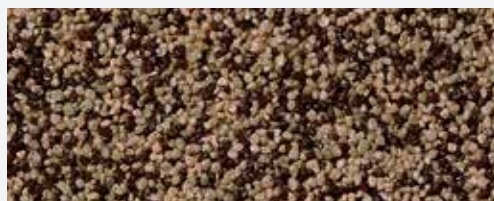
M 318 Rax