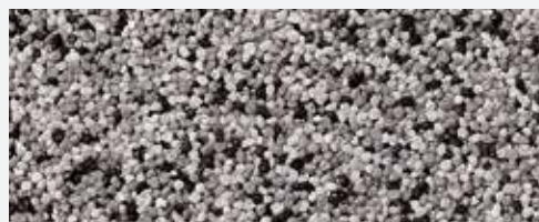
M 327 Rushmore