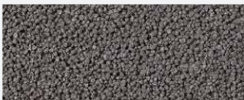
M 330 Elbrus