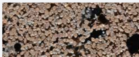
M 340 Babia