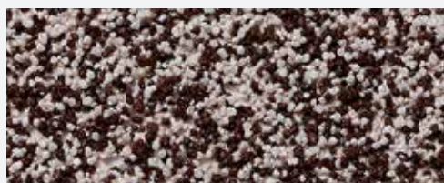
M 306 Parnass