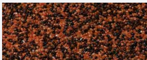
M 314 Ararat