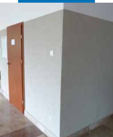
Пример на използване на Mape-Mosaic върху стена от комуникационно трасе.