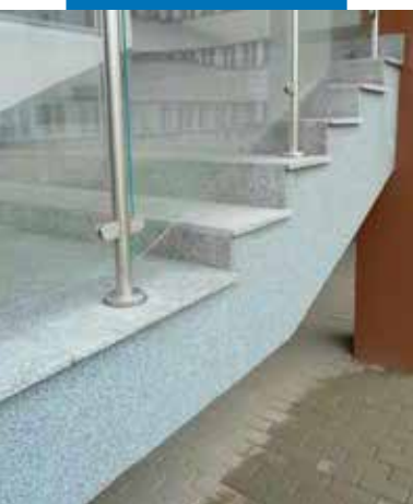
Естетическо завършване на мраморни стълби чрез използването на Mape-Mosaic.