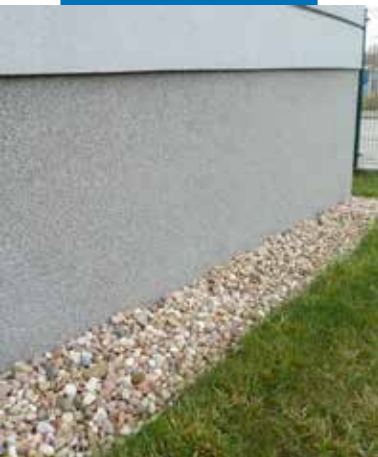
Пример на използване на Mape-Mosaic върху цокъл на сграда.